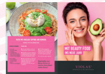
Beispielhafte Aktion: Beauty Food (Januar/Februar)